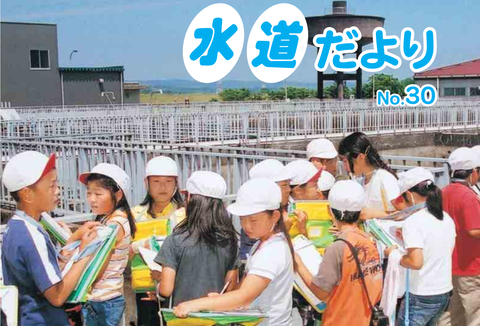
「妙見浄水場を見学する小学校の子どもたち」