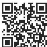
サンプル QR コード