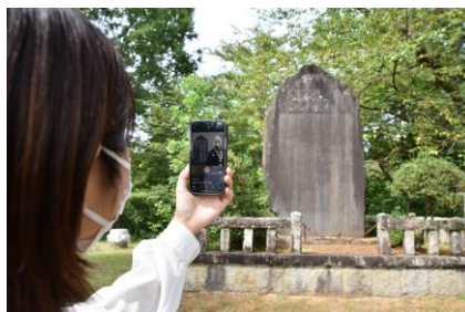
AR碑文の現代語訳(イメージ)