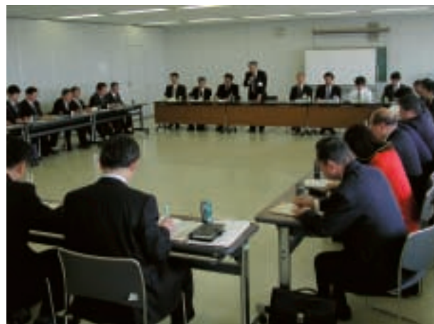
前橋広域市町村任意合併協議会視察の様子

視察は前橋広域側8人の事務局員から対応していただき、事務局次長から1時間30分ほど説明を受け、その後、質疑を行いました。質疑では、多くの委員から質問があり、2時間の視察の予定が40分以上超えてしまうほど熱心に行われました。