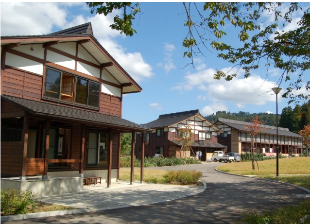
隊員用住宅 ↑左手の一軒家です。