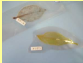
写真はイメージです →