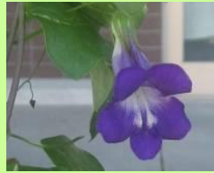
鐘形の花が長期間楽しめる「アサリナ」