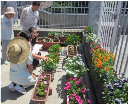
←ケアハウス けやきの杜の 屋上花壇