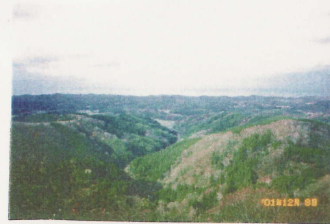
小木ノ城跡から日本海と佐渡を望む