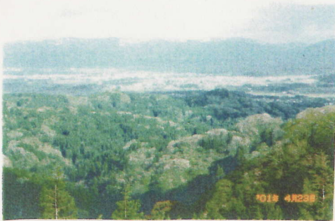
見晴し広場から長岡市外と東山を望む