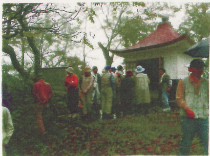
薬師峠 (峠の薬師堂) (県道に下る細道がある)

峠には「峯之薬師堂由緒」の看板がある。江戸時代から、宮本と石地を結ぶ要路であった。1976年に、薬師トンネルが完成。