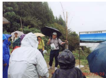
10月23日 二手に分かれてウオーキング、合流後の交流会の様子