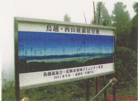
見晴し広場の案内看板