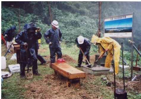
9月22日 雨天の中で案内看板とベンチの設置作業の様子