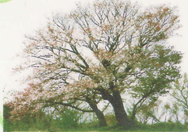
物見山のカスミザクラ 大種 (胸高直径 83 cm、樹高 12m)

二田城跡は別名三島谷城跡。高台からの 360 度の眺望は圧巻。エノキの高木が多い