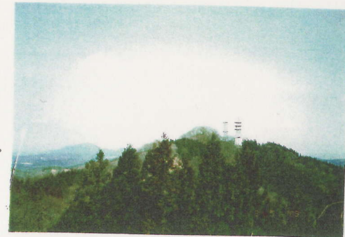
芝峠近くから小木ノ城跡を見る (遠くに弥彦山)