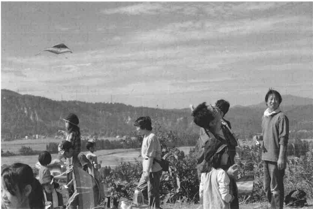
コスモス祭（さんご山山頂での飛行機飛ばし）