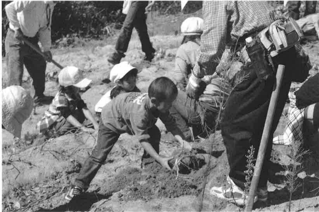
コスモス祭 (いもほり)