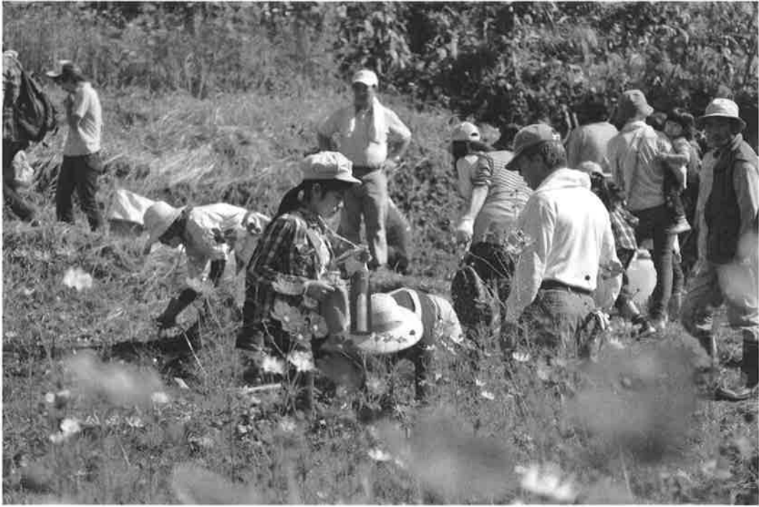
コスモス祭ハイキング