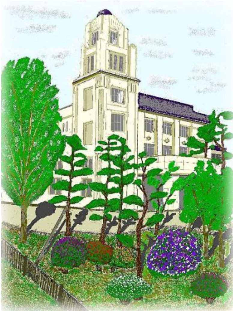
長岡市公会堂(大正末期~昭和32年) 画: 斎木勝郎