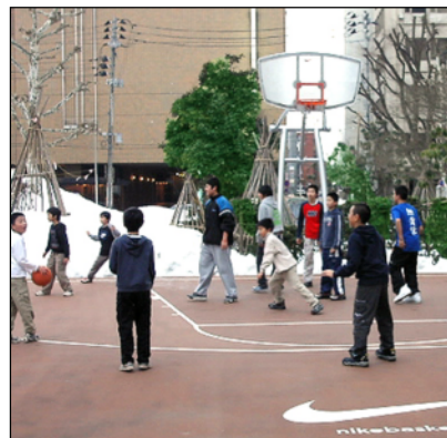
ストリートバスケットボール