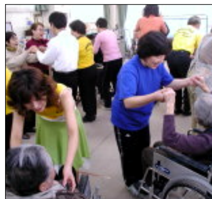
高齢者とのふれあい