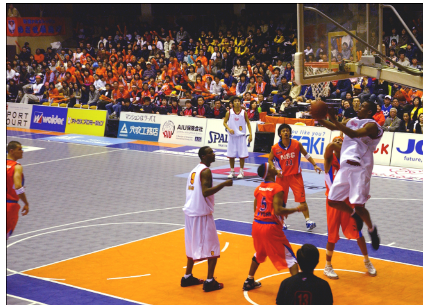
アリーナでのスポーツイベント