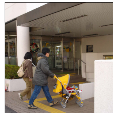
ちいさなお子様連れでも気軽に