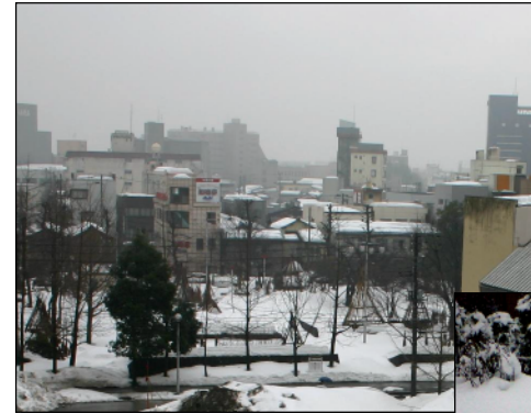
雪に閉ざされた長岡セントラルパーク