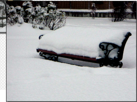
冬期の利用価値が低い宝田公園