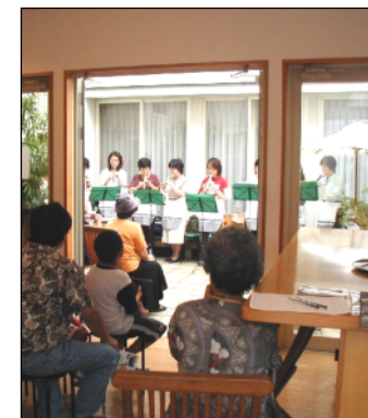
フリースペース、オープンカフェ