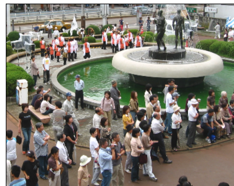
賑わいのスペース: 宝田公園