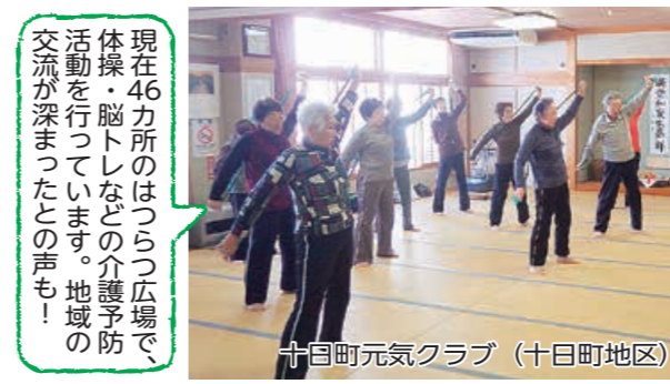
十日町元気クラブ(十日町地区)

更新あり) 仕事Ⅱ①施設の管理・運営など②施設の管理・運営補助など③施設・設備の維持管理など 勤務地Ⅱ市立劇場またはリリックホール 報酬Ⅱ①月額166,000円 ②③日額6,390円(社会保険に加入) 勤務日Ⅱ土・日・祝日を含む月21日程度(1日7時間45分) 選考方法Ⅱ書類審査、面接、適性検査 ④4月10日(火)～23日(月)にハローワーク長岡、同財団(☎29・7711)ホームページにある申込書で