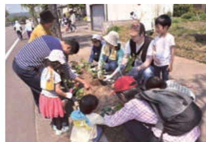
▲昨年最優秀賞を受賞した「関原地区花いっぱい運動推進協議会」

●住居表示実施地区に建物を建てる際は届出を 地番(○番地○)ではなく住居表示番号(○番○号)が住所や所在地になる長岡、栃尾と板橋地区の一部では、建物(倉庫、看板などを除く)を建てる際に届け出が必要。建物の基礎完成後、住居表示実施地区で建物を新築、建て替え、所有者の変更などをする建物の所有者、土地の地番がわかるもの、建物1階平面図、位置図など ④市民課☎39・2019、栃尾支所市民生活課☎52・5835、与板支所市民生活課☎72・3160 ●高額医療・高額介護合算制度の申請を受け付けます 医療費と介護サービス費の年間(平成30年8月1日～令和元年7月31日)の自己負担額の合計が限度額を超えた場合、申請により超えた額を支給します。 ◇申請方法 ①国民健康保険、後期高齢者医療制度の加入者:支給対象者には、申請書を送付します。 ②①以外の人:それぞれの医療保険に申請してください。 ③平成30年8月以降に加入保険が変わった人や亡くなった