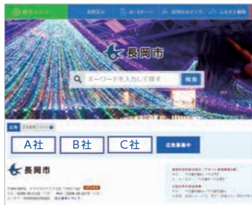
▲広告を掲載するトップページ

募集数=18枠 掲載期間=4月～来年3月(1カ月単位) バナー広告規格=縦70×横180ピクセル。GIF、JPEG、PNGで容量20KB以内(静止画のみ) ¥月2万円(一括前納。掲載期間中の取り下げなどに伴う返金はしません) 掲載位置=トップページ ④2月3日(月)～3月6日(金)に広報課☎39・2202へ ※詳しくは市ホームページで