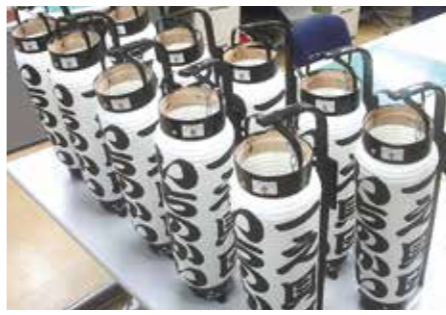
▲一之貝区(栃尾地域)の提灯

●宝くじ助成金で町内会の用品などを整備しました 自治総合センターが宝くじの社会貢献広報事業として実施するコミュニティ助成事業を活用して、次の用品を整備しました。 ☎市民協働課☎39・2291