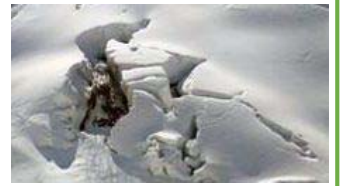
▲クラック (雪の裂け目)