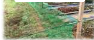
畑を囲う対策事例