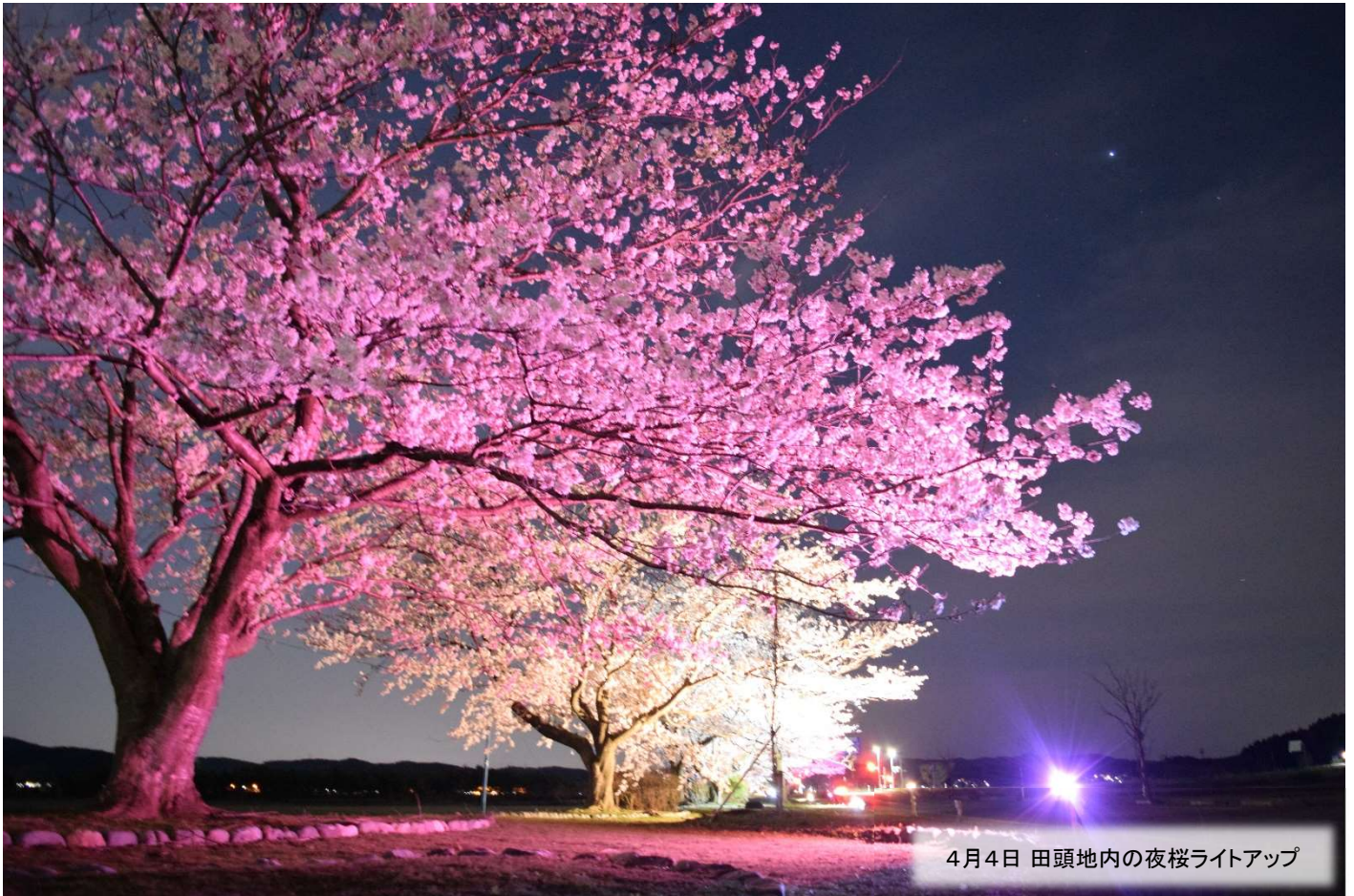
4月4日 田頭地内の夜桜ライトアップ

■発行／編集■ 長岡市寺泊支所地域振興・市民生活課 ☎0258-75-3111 FAX 0258-75-2238 E-mail tr-chiiki@city.nagaoka.lg.jp