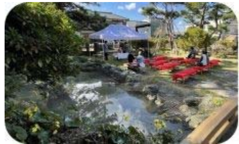
▲昨年のつわぶき茶会