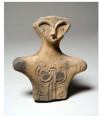
大形土偶「ミス馬高」 （国重要文化財、 馬高縄文館所蔵）

問い合わせ：科学博物館・馬高縄文館 小熊・小林 TEL 0258-32-0546