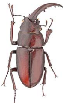
▲ノギリクワガタの雌雄モザイク

★最新研究に基づき『世界のクワガタムシ大図鑑』(2010年刊)にも掲載されていない種を多数含む、約600種を一挙公開します。雌雄モザイク※などの貴重な標本も展示します。多様なクワガタムシを通じて進化生物学を学べるよう、詳しく解説しています。