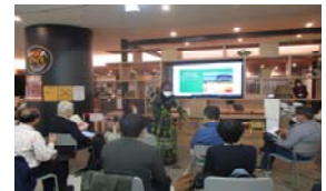
▲前回のWorld Cafeの様子(ケニア出身の方が講師)