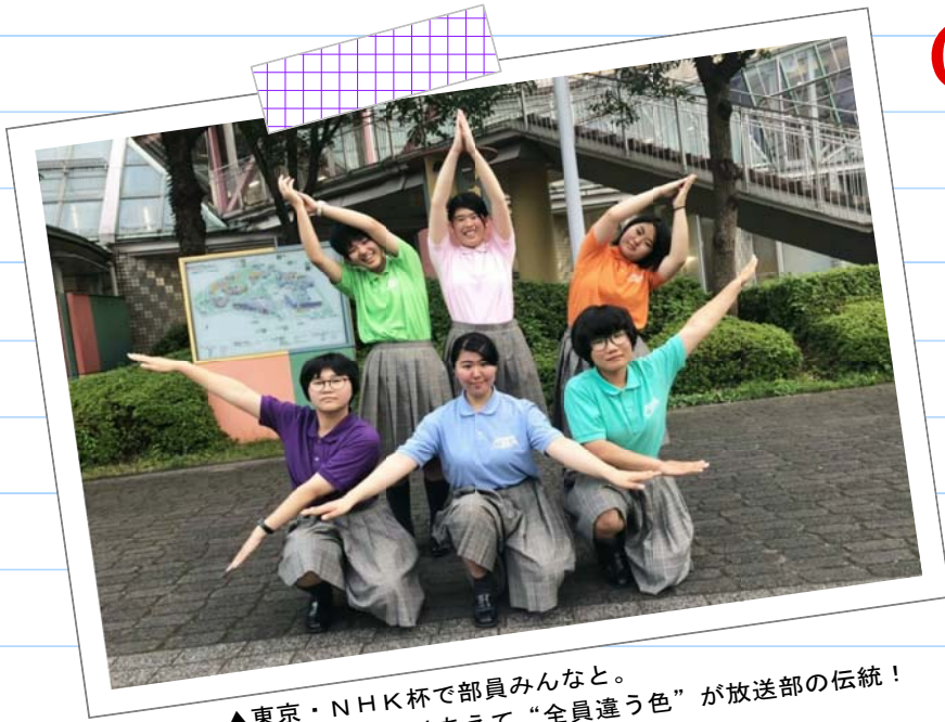
▲東京・NHK杯で部員みんなと。部活Tシャツはあえて“全員違う色”が放送部の伝統！