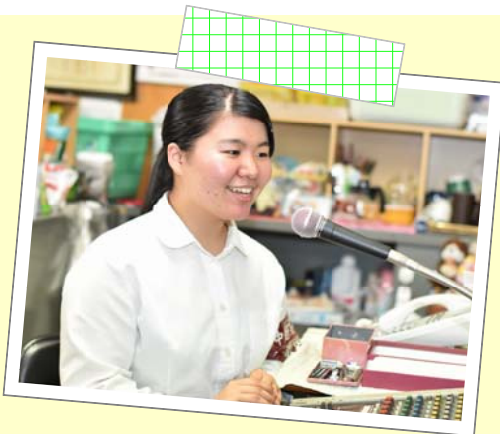
【早織さんのある日の一日】