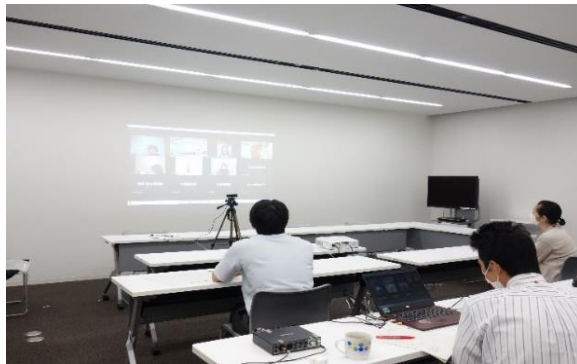
Zoomで会議を重ねました

市民活動フェスタは対面での実施は叶いませんでしたが、オンラインで意思疎通を重ねた結果、活動PR展示会を開催。「わくわくを止めない」を合言葉に、活動を次年度につなげています。