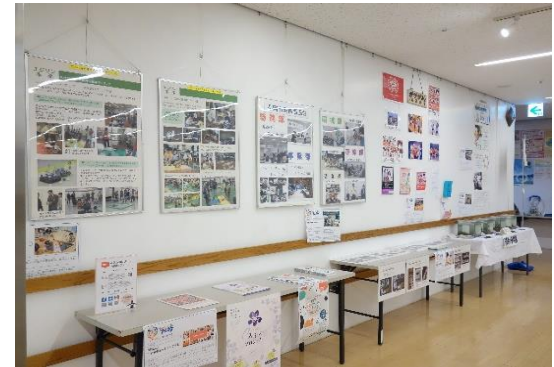
参加団体の活動紹介パネル展を開催