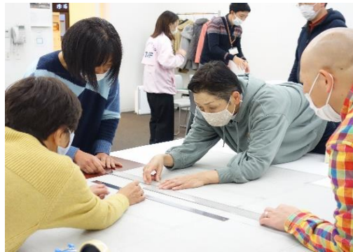
実行委員が展示物を作成