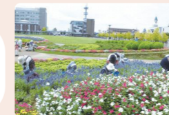
市民花だんを手入れする様子

長岡市緑花センター「花テラス」で行われる「花いっぱいフェア」に行ったり、「花いっぱいコンクール」に参加したりしよう。