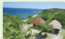
和島オートキャンプ場