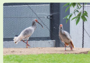
トキと自然の学習館