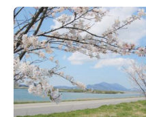
信濃川堤防の万本桜