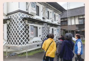
醸造のまち摂田屋の散策