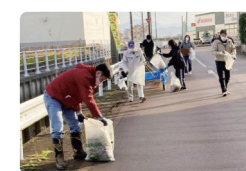
クリーン作戦の様子