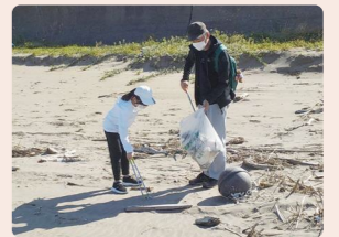
海岸清掃イベント