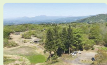
八方台いこいの森