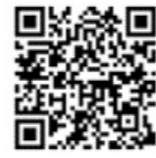
動画ライブラリー