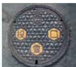
※投雪口のふたには、「投雪口」と書いてあります。表示のない一般のマンホールには、絶対に雪を入れないでください。

長生橋の交通規制(全面通行止)について 長生橋の梁に付着した雪の塊が落下することによる事故が発生しています。 県では降雪する恐れがある場合、長生橋を全面通行止めにし、放水車による雪の除去を行います。全面通行止めは主に深夜としますが、朝方から日中にかけての降雪状況によっては昼間に行う場合もありますので、その際はご協力をお願いします。