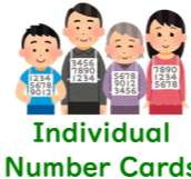
Individual Number Cards