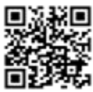
Individual Number Card