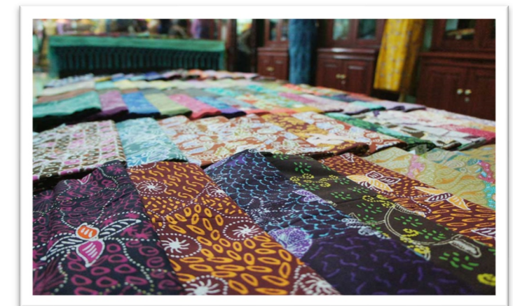
ずがら バティック図柄