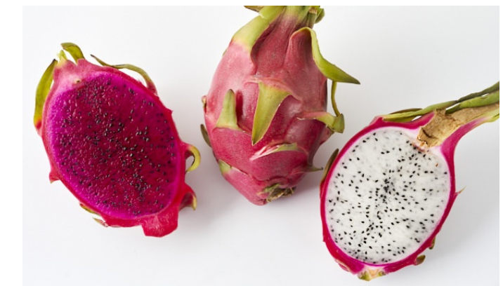
ドラゴンフルーツ