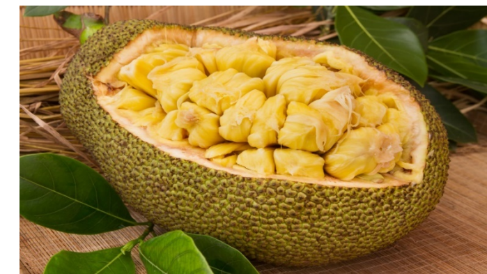
ジャックフルーツ