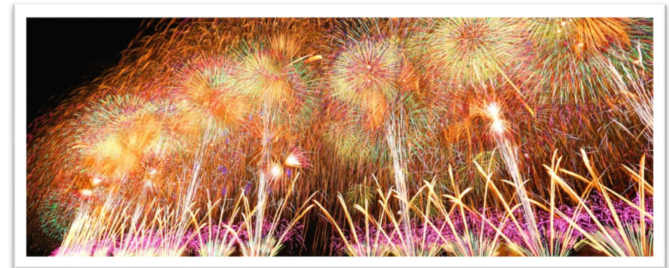
ながおかはなび 長岡花火

裕： ひろしま 広島です。 ひろしま 広島は い 行った こと があります。 きれい とても綺麗です。