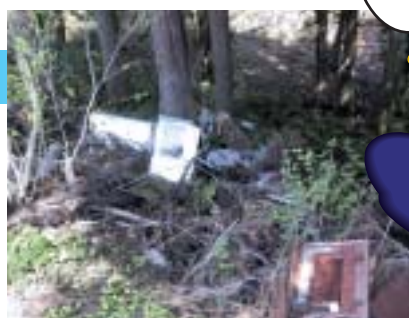
山間地に捨てられた家電製品等