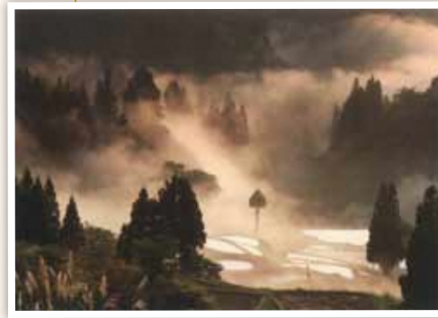
6 竹沢地域 震災後ではめったに見ることができない、めずらしい霧。