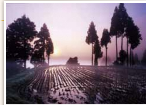
9 大久保地域 稲を刈り終えた棚田がみせる幻想的な姿。