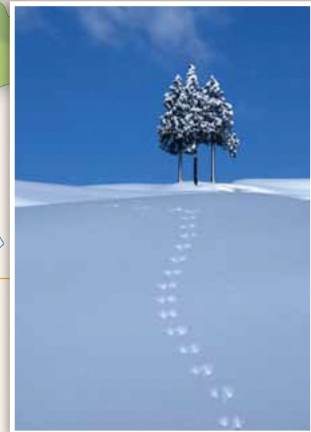
11 池谷地域 まっさらな雪のキャンパスに動物たちの足跡が残る。