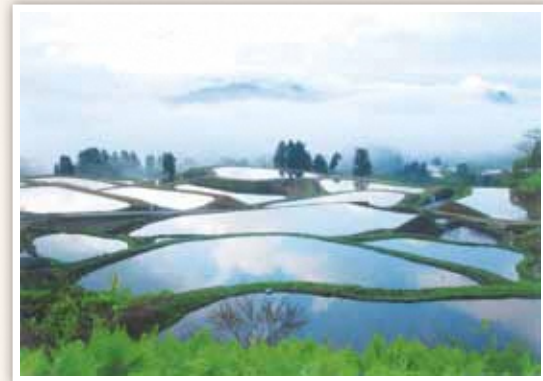
1 虫亀地域 金倉山中腹にて、棚池に青空が映り込む山古志ならではの風景。