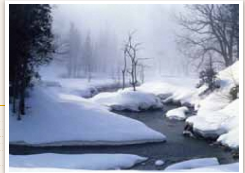
8 木籠地域 降り積もる雪を割るように流れる冬の川。