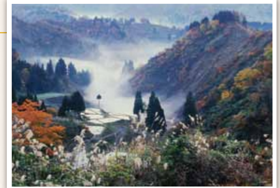
7 竹沢地域 秋に色づいた風景を流れる霧の川。