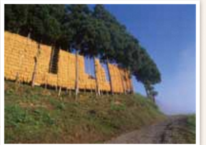
10 大久保地域 山古志では昔ながらのはざ掛けの風景を見ることができる。