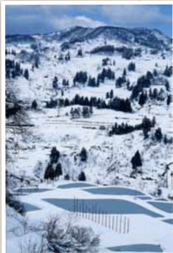
4 油夫地域 冬の晴れ間に棚田が輝く風景。