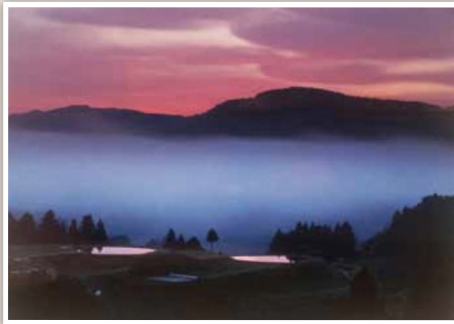
2 虫亀地域 静かな朝霧の中に光る美しい田んぼの風景。