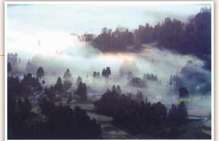
12 種芋原地域 山古志のなかでも特に棚田が多くみられる種芋原。