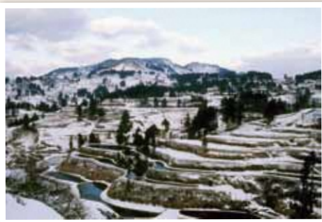
3 虫亀地域 山古志小中学校付近から望む、春を待つ棚田の風景。