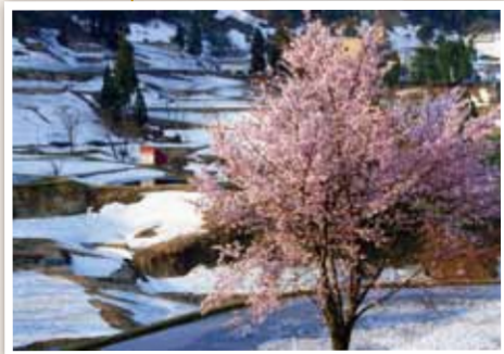
5 油夫地域 山古志地域では珍しい一本桜。