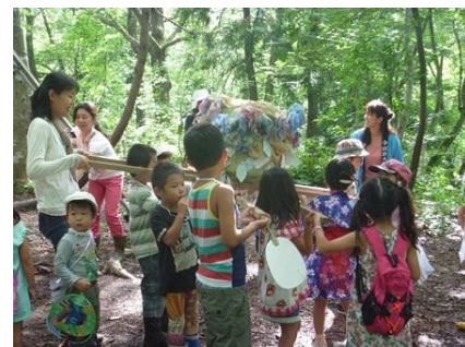
自然の中でたくさん遊ぼう!