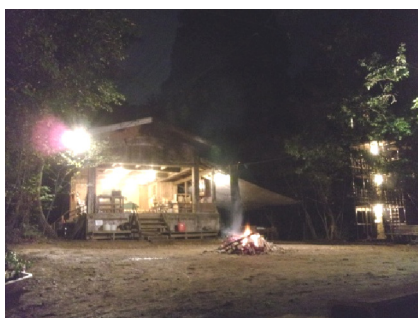
夜の東山はハラハラドキドキ!