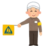
地域のボランティア

家に閉じこもりの状態になると、心身の機能が衰え、フレイルになる恐れがあります。外に出て、積極的に人と交流し、日常生活が活発になるように努めましょう。