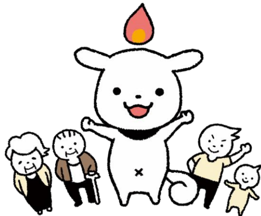
権利擁護支援課イメージキャラクター トモニンくん

担 当：長岡市福祉総務課 受託運営：社会福祉法人長岡市社会福祉協議会 権利擁護支援課