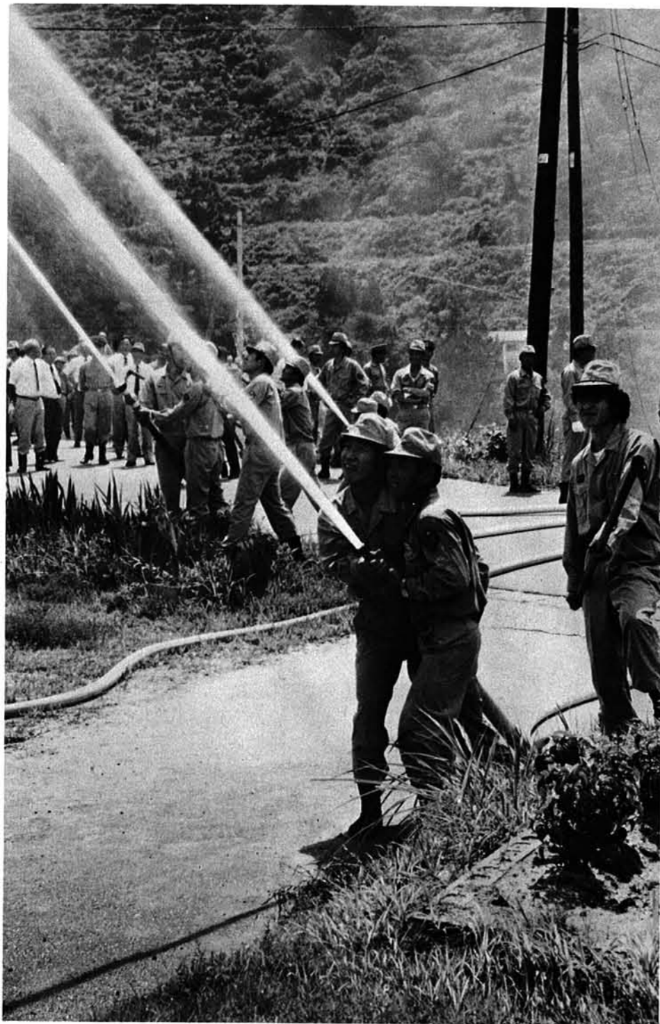
七月二十九日、村の消防演習が山古志中学校グラウンドで行われました。