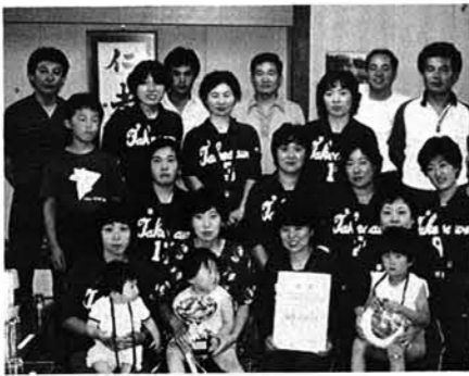
優勝の竹沢チーム