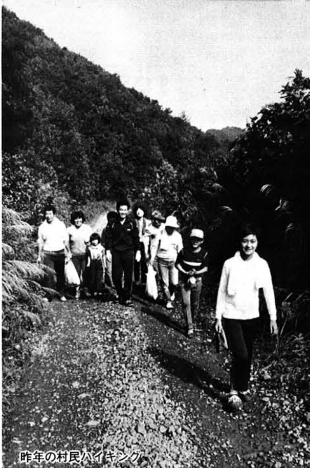
昨年の村民ハイキング

今年度の社会教育事業を計画しました。下の表のとおり、期日や会場が未定のものもありますが、決まりしだいお知らせしますので、どうぞご参加ください。とくに今年、四月に山古志村公民館を設けており、七月には村民会館もオープンします。これらを基に活発に進めていきます。みなさんからも、いろんな活動をしていただきたいと思います。