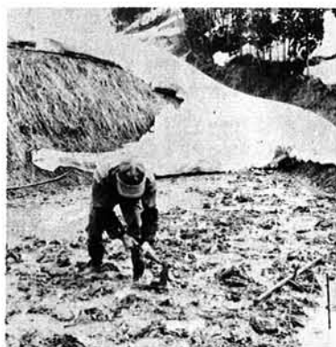
ブナも少しづつ芽を吹き出し始めています。