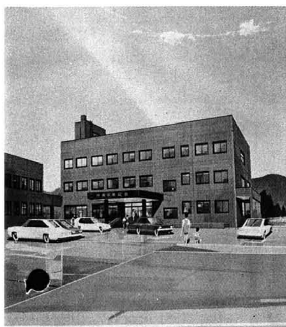
.....右が役場、左がコミセン、診療所

▼ロビー...みなさんの休憩、談話の場として利用いただきます。 ▼外部通路...コミセン、診療所につながっています。 ▼2階 ▼事務室...助役および総務課、産業課(農業委員会を含む)、建設課が入ります。 ▼村長室、応接室...新庁舎では村長室と応接室を独立させまし