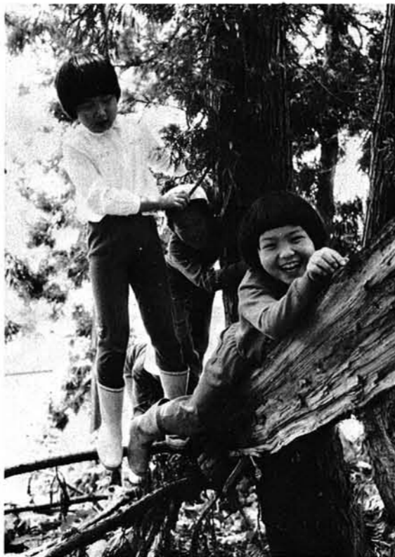
→ 昨年6月、虫亀小・学校林で