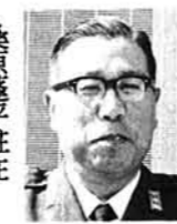
多田種芋原駐在 「守門産」 碁・将棋・釣の先生