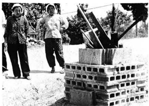
ブロックで焼却ろを