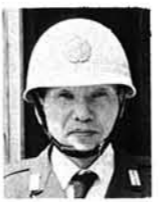
富井竹沢駐在 「十日町産」 百人一首・詩吟の迷人