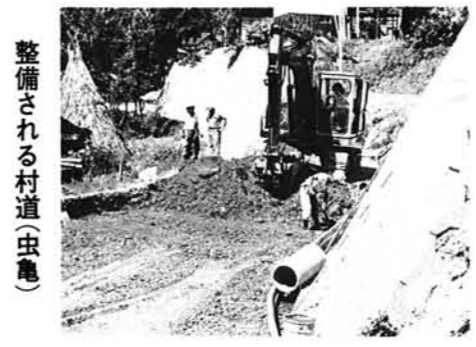
整備される村道(虫亀)