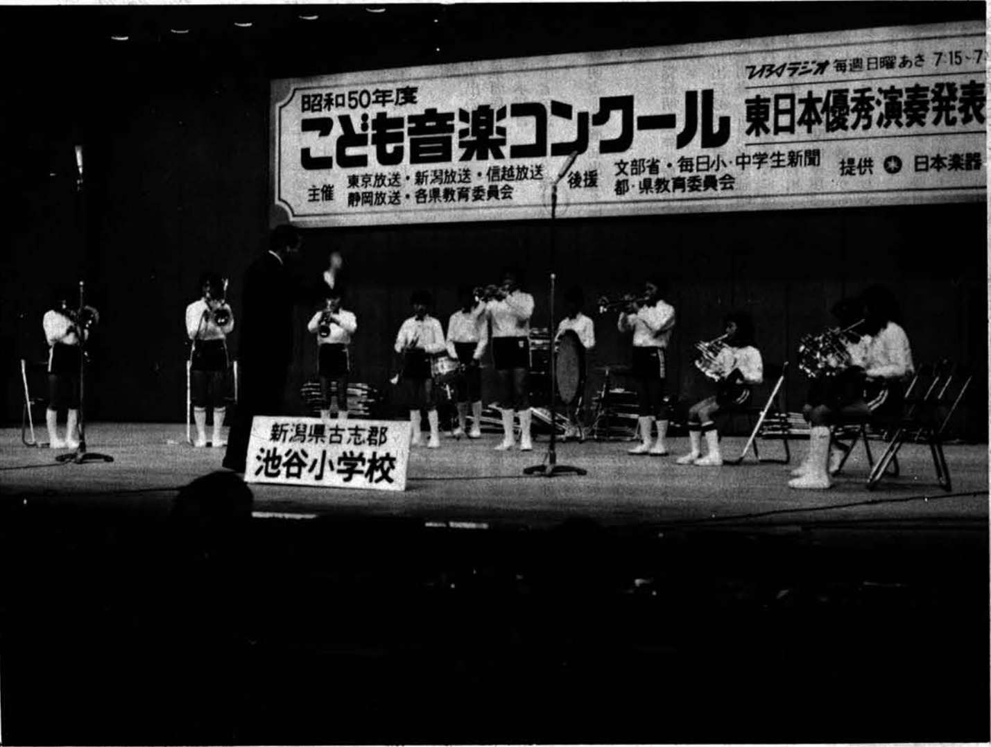
新潟県古志郡 池谷小学校