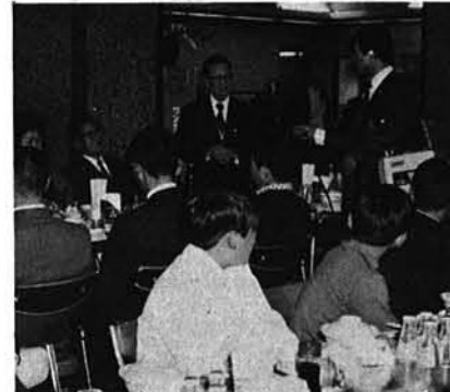
あいさつする村長