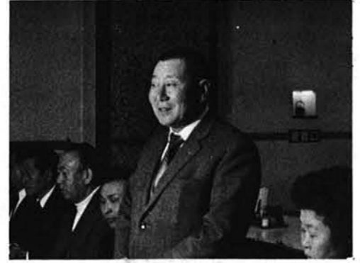
子どもたちをはげます在京者代表

は否めないが小人数だけに気の合うことは他校の真似の出来ないものがあり、演奏にそれが現われ、コンクールの演奏曲目「インドの女王」を立派に演奏しそのすばらしさは審査員に感銘を与えた模様です。 東京大会出場とあって、去る一月二十日同校の体育館に於いて歓迎会が開催され、父兄はもちろん部落ぐるみの盛大なものであり、こどもたちも「皆さんの応援に答えるため、あがらず立派に演奏する」と誓い、今大会でその成果を上げました。 また、東京会場には部落出身者約二百人が応援にかけつけるなど微笑ましい場面もありました。