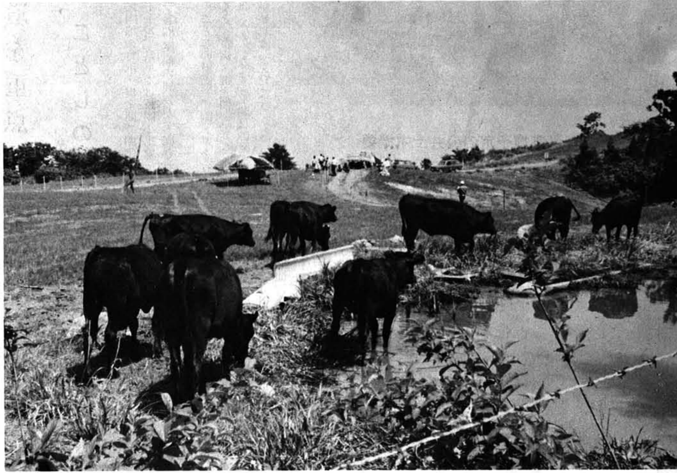
観光にも一役買って のびのびと草をはむ放牧牛 (萱峠牧場)

発行 新 湖 古 志 郡 山 古 志 村 役 場 電 話 竹 沢 局 17 23 78 印刷 刷 川 印 刷 所