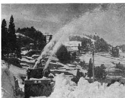
モータリゼーションの進展により、道路整備と冬期の交通確保が強く要求されています

道路は、自動車の普及や日進し、広く生活圏に対応して、村の開発は何年にもわたって、道路網を整備し、冬期の交通を確保することにあります。この重点施策として、油夫一山中線(油夫一山)の改良と、除雪対策に八百三十一万円を計上しました。 そのほか、県道の改良や、舗装を行うための負担金二百三十九万円、除雪機の新調に備へる七百七十五万円を積み上げています。