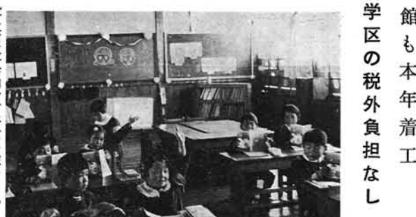
ハイ、元気で手を上げる良い子たち

中学校 体育館も本年着工 学区の税外負担なし 九千五百五十万円を計上して、体育館の建設に着手します。これは、前年より七十七万七千七百七十九円(三・八二%)増額されています。