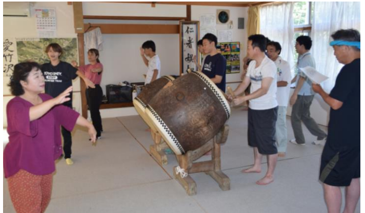
▲盆踊り練習の様子（竹沢）

8月13日（火）～17日（土）東洋大学の学生44名が、種芋原、虫亀、竹沢、梶金、三ヶ地区に分かれ、お盆行事を中心に住民と一緒に集落活動を盛り上げました。この他にも、野菜を集荷し販売したり、そば打ち体験やゲートボールを行うなど、地域住民と生活を共にすることで親睦を深めました。