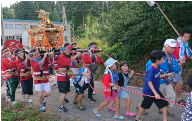
▲お神輿の様子（種芋原）