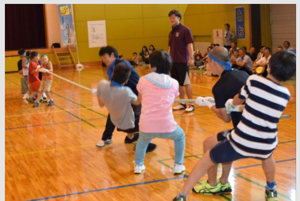
▲昨年のやまこし総合レクリエーションの様子