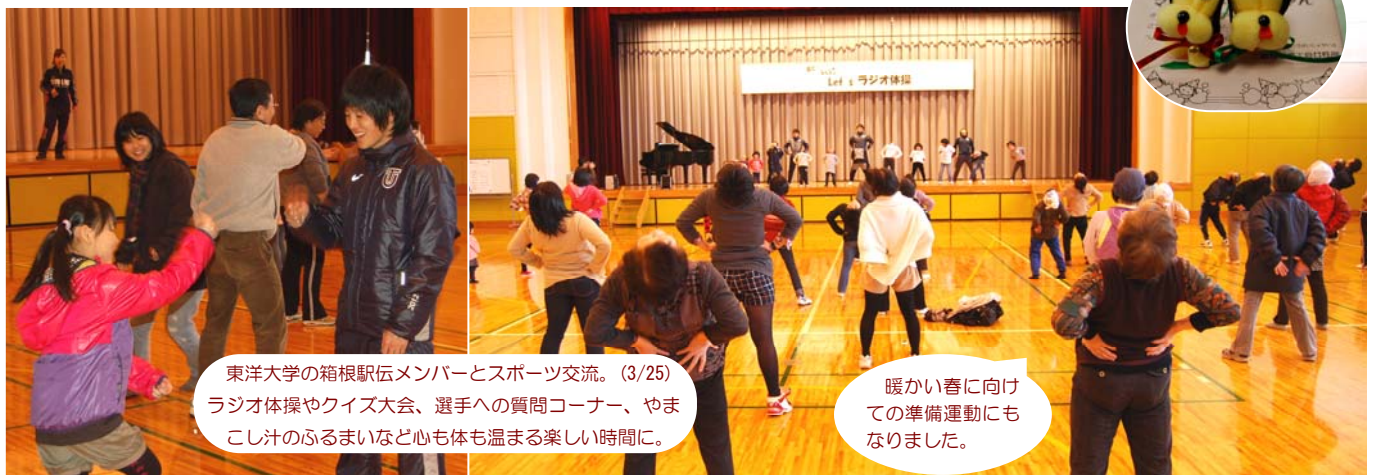
東洋大学の箱根駅伝メンバーとスポーツ交流。(3/25) ラジオ体操やクイズ大会、選手への質問コーナー、やまこし汁のふるまいなど心も体も温まる楽しい時間に。