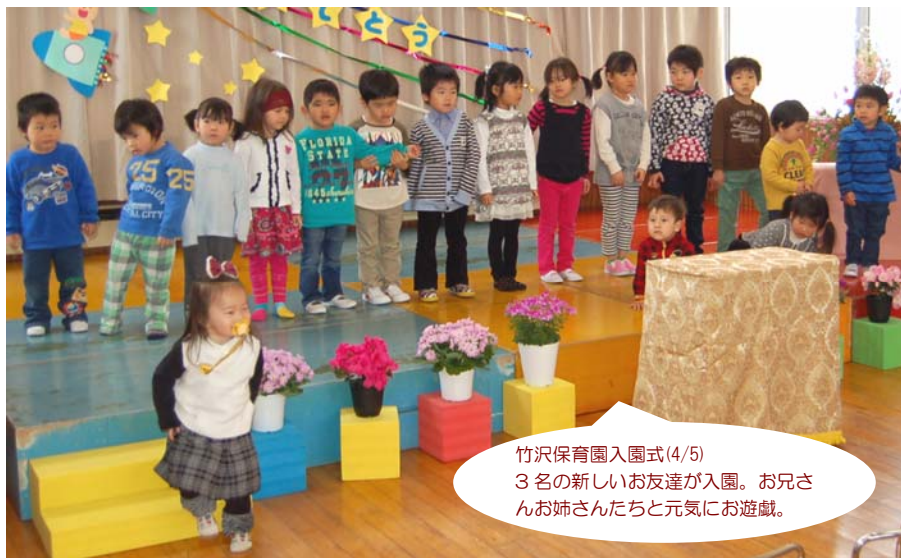
竹沢保育園入園式(4/5) 3名の新しいお友達が入園。お兄さんお姉さんたちと元気にお遊戯。