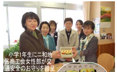
小学1年生に二和地区 商工会女性部が交通安全のお守りを贈呈