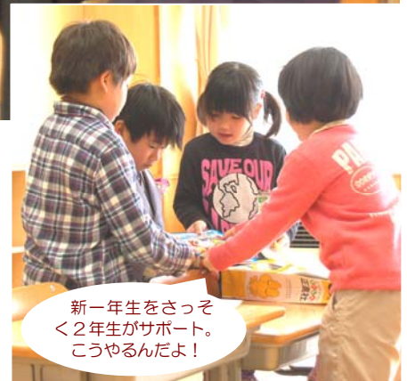
新一年生をさっそく 2年生がサポート。 こうやるんだよ！