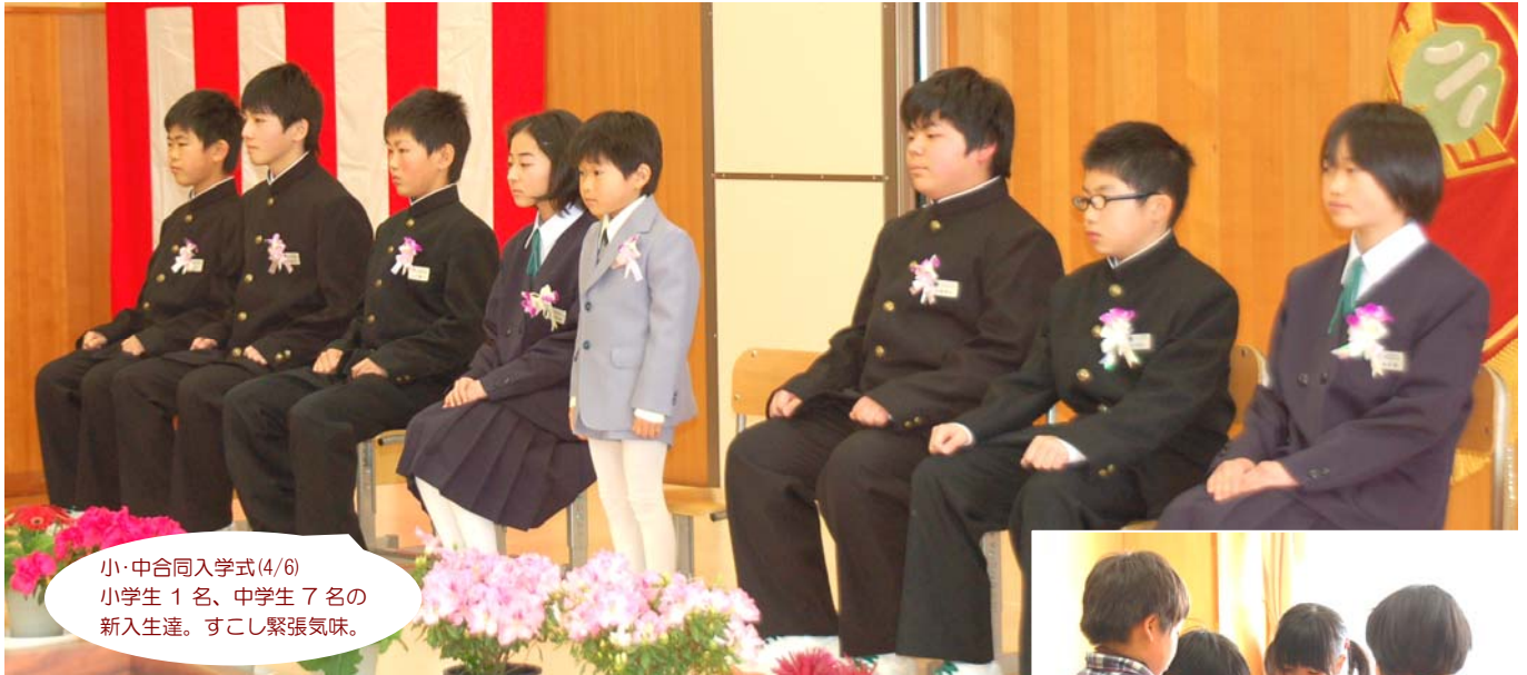
小・中合同入学式(4/6) 小学生1名、中学生7名の 新入生達。すこし緊張気味。