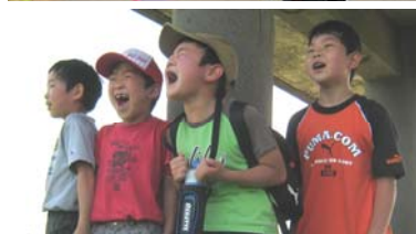
健康ウォーキング 柿町から竹 之高地まで約8キロのコースを ウォーキング。青空ぼうけん塾メ ンバーも参加。(6月12日)