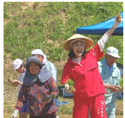
小林幸子田で田植え 小林幸子 さんが山古志、六日市の小学生 や参加者と一緒に田植えをし て、汗を流しました。(6月2日)