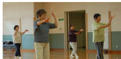
6月3日の教室の様子 ←

毎月第1、第3木曜日の月2回行っている民謡体操教室。無理なく誰でも気軽に体を動かせる」と好評です。随時受付しています。見学のみでもOKです。送迎バスも用意しますのでご相談ください。