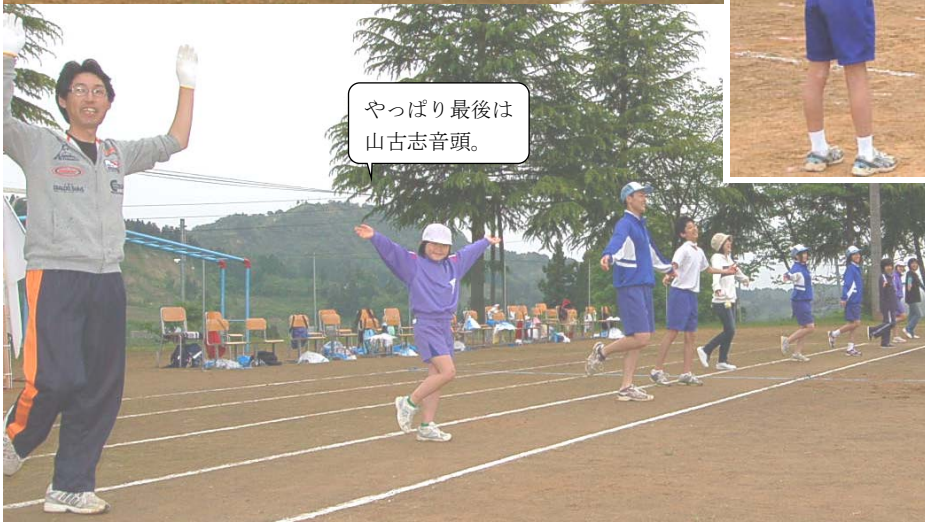
やっぱり最後は 山古志音頭。