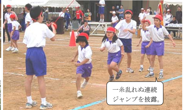
一糸乱れぬ連続 ジャンプを披露。