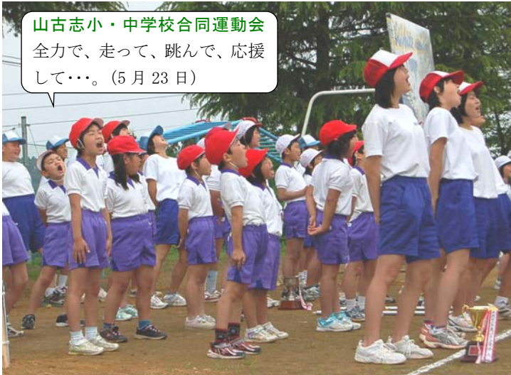
山古志小・中学校合同運動会 全力で、走って、跳んで、応援 して…。(5月23日)