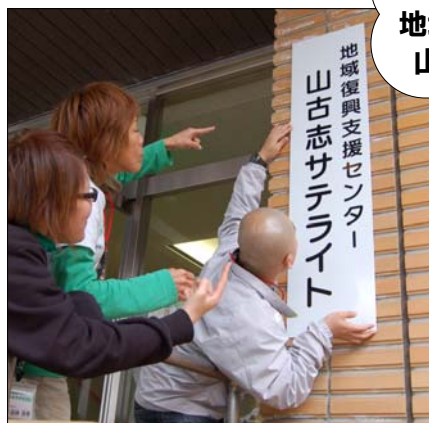
↑組織変更に伴い、山古志会館入り口の看板も新しくなりました！