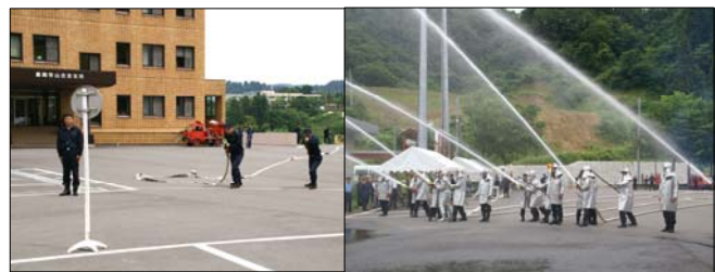
↑ 昨年度の消防演習の様子。小型ポンプ操法、放水訓練