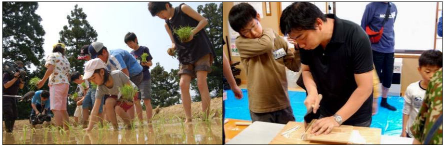
左：初めての田植え。この後泥まみれに… 右：あまやち会館でそば打ちを体験

大 型連休後半に、農業体験ツアーが開催されました。東京や千葉、愛知などから7組23人の親子が訪れ、田植えやそば打ちを体験しました。