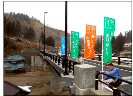
↑「元気をありがとう!」「新しい山古志をつくろう!」「がんばります!山古志」書かれた緑・青・オレンジの鮮やかなのぼり旗を各集落に設置(木籠橋)

集落の人々は「元気をありがとう」など住民の思いをつづったのぼり旗100本を各集落に設置。春のそよ風になびく旗に復興を誓いました。