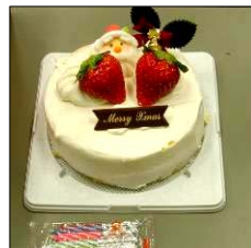
↑今年配られたケーキ