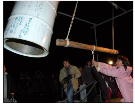
↑一人ひとり「希望の鐘」をつきました