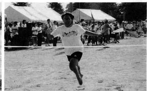
年令別リレー男子優勝 東竹沢分館