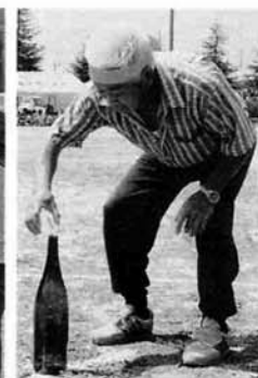
上手に入ったかな