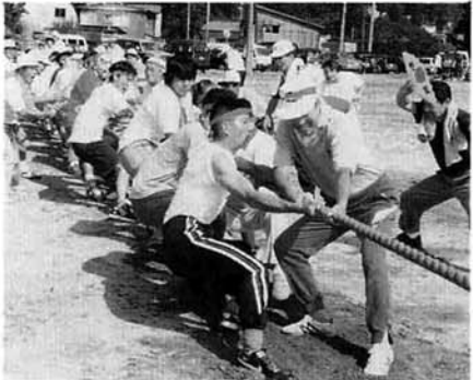
さすがに強い虫亀分館

第30回山古志総合レクリエーション大会 八月二十三日(日)山古志中学校 グランドで第三十回山古志総合 レクリエーション大会が開催さ れました。 優勝 虫亀分館 二位 池谷分館 三位 種芋原分館 応援賞 東竹沢分館