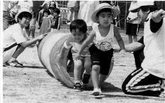
小さい子供も幼児レースでガンバりました