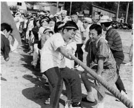
応援団も選手といっしょに