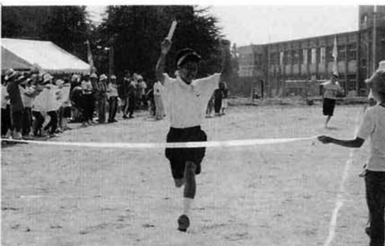
年令別リレー女子優勝 池谷分館