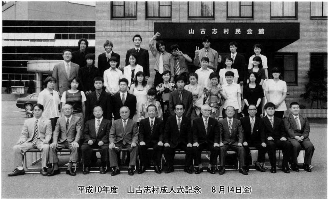
平成10年度 山古志村成人式記念 8月14日(金)