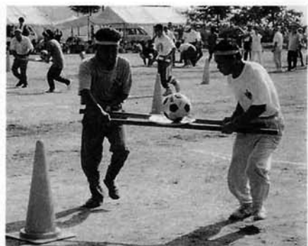
心を合わせて運びました