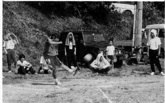
やった!ホームラン