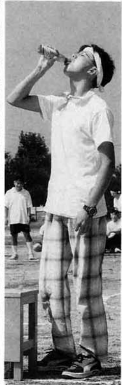
ラムネはとってもうまい!