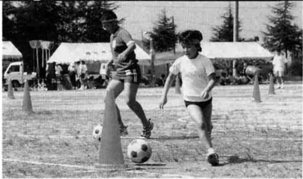
上手な足さばきを見せてくれました