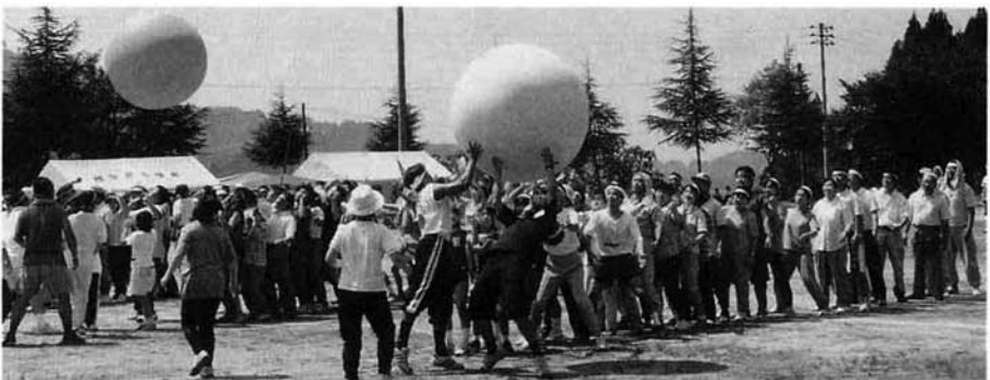
大きな玉をいっぱい投げて……