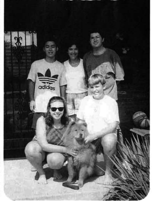
ホームステイ先の家族と一緒に!

ホームステイと体験しました。ホームステイは、スプリングフィールドのごく普通家庭に独りどけ込んで生活を味わうのです。辞書やジェスチャーを苦使し、無謀にも挑戦してました。詳しい話は後日、機会があれば報告します。