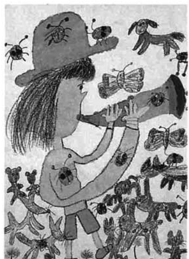
▲動物や虫を書いているときに楽しかった。笛の形や手の形を書くとき注意しました。