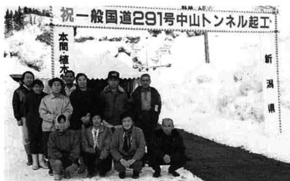
▲地元の方々も起工式に大勢かけつけました

中山隧道は小松倉と水沢新田を結ぶ、全長八七五m、幅二m、高さ二・五mで小型車が通れるほどの素掘りの隧道で、昭和三十七年に県道、五十七年に国道一九一号線に認定され、車社会の到来にもない平成三年度にトンネルを含む一・七km区間が道路改良事業の採択を受け、工事の早期着工が待たれていました。