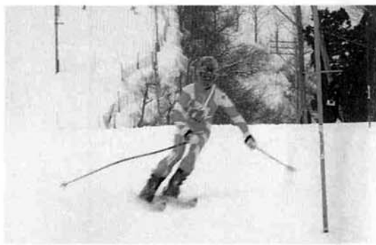
ゴールを目指して積極的に滑る!

保険料は配偶者の加入する年金制度がまとめて負担しますので、自分で納める必要はありません。しかし、必ず第三号被保険者であることを住民票のある市町村役場に届け出なければなりません。第三号の届け出が一年以上遅れると、一年を超えた期間の保険料は未納扱いになり、将来、基礎年