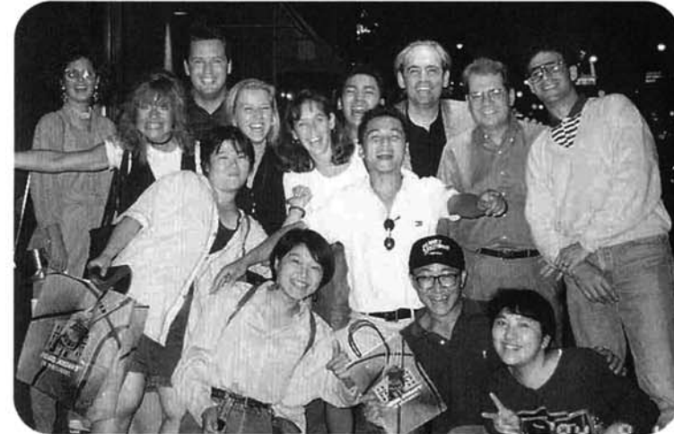
街角で見知らぬアメリカ人とパフォーマンス?

手振り)と雰囲気もとてもビックリです。2日目の夜、シカゴの人達と交流会を兼ねた夕食をしました。同じテーブルには日本人4人、アメリカ人4人の8人の輪となりました。僕のジェスチャー付き英会話もけっこう通じるものです。ありさつ、自己紹介、一般的な会話と緊張感の中にもなかなか進みます。時間が進むにつれ話題がありません。愛想笑いを連発しながら食事している、隣の30歳過ぎの夫人が「動物の鳴