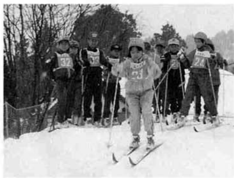
声援をうけてスタート!