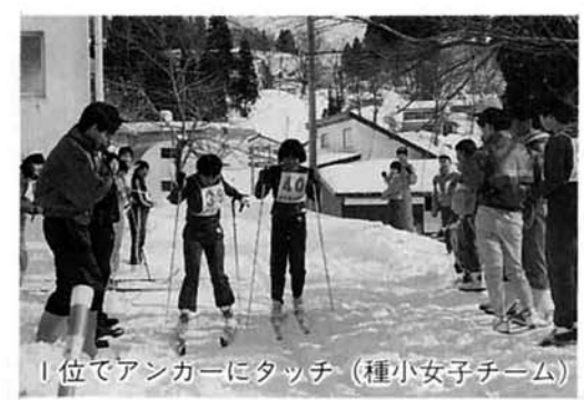
1位でアンカーにタッチ (種小女子チーム)