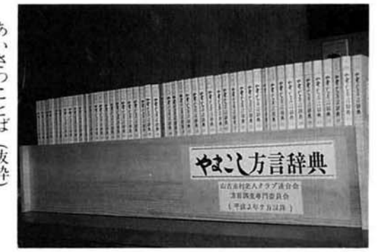
あいさつことば (抜粋)

朝——あつちやくなるげだのお 昼——ひらがりだねかの 夜——いつとまにくらく なつたのんし