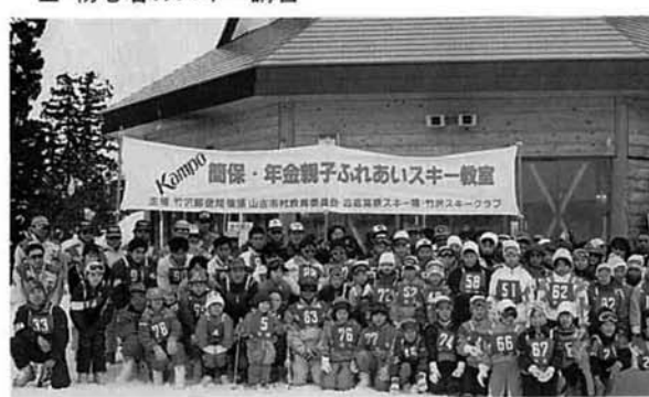
▲2月10日に参加されたみなさん

二月十日(日)古志高原スキー場で、親子ふれあいスキー教室が竹沢郵便局主催、竹沢スキークラブなどの後援で開催されました。 村内はもちろん、近郷からの希望者も多く、定員をオーバーする総勢九十五人の参加者となり、主催側もうれしい悲鳴、指導員の確保に一苦労。 午前は、親子分かれてのクラス別にスキー講習会が行われた。歩くこともおぼつかない初心者も、後半にはゆるい斜面での滑降もで