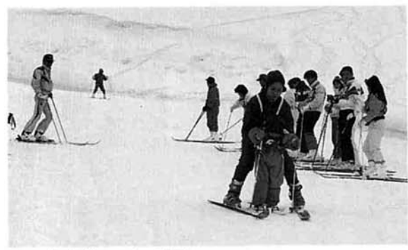
▲初心者のスキー講習

二月十日(日)古志高原スキー場で、親子ふれあいスキー教室が竹沢郵便局主催、竹沢スキークラブなどの後援で開催されました。 村内はもちろん、近郷からの希望者も多く、定員をオーバーする総勢九十五人の参加者となり、主催側もうれしい悲鳴、指導員の確保に一苦労。 午前は、親子分かれてのクラス別にスキー講習会が行われた。歩くこともおぼつかない初心者も、後半にはゆるい斜面での滑降もで